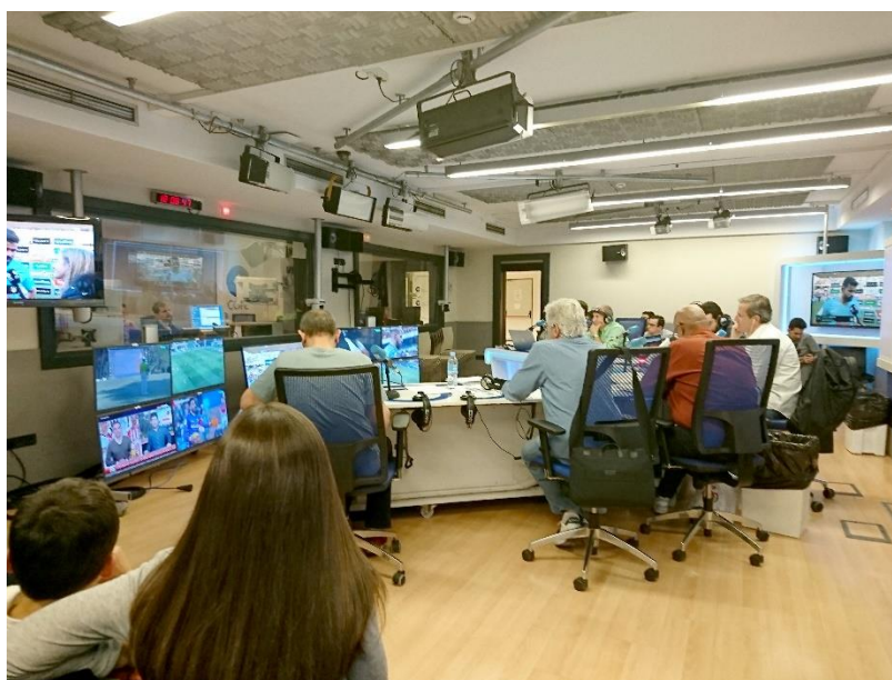
Tiempo de juego , febrero de 2019.

Describe el programa Tiempo de juego como un renovado ejercicio de deporte, alegría y amistad, destacando como uno de sus momentos estelares los meses del confinamiento de 2020 cuando emitió una programación deportiva sin la celebración de competiciones. Subraya la valentía y la fe de unos periodistas que trabajaban por la felicidad de la gente en tiempos de adversidad.