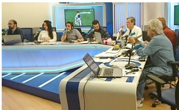
Tiempo de juego , febrero de 2019.

- Hasta que se me acaben las palabras . Madrid: Aguilar, 2022.