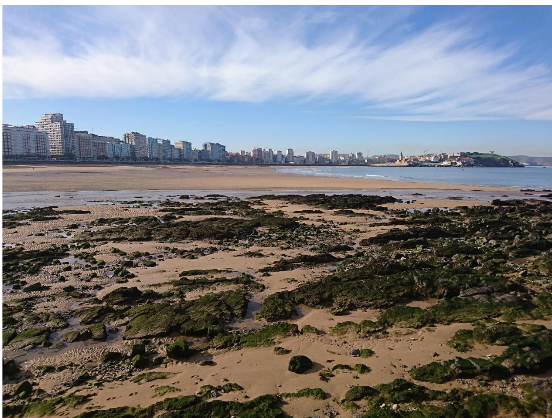
Playa de San Lorenzo, en Gijón (España).

Veinte años más tarde, todavía continúa la navegación por el ciberespacio con la ayuda de una rosa de los vientos, de elaboración propia, en la que sobre la luna de San Jorge el horizonte del idioma español en el deporte presenta rumbos orientados hacia la historia, con la labor de las instituciones de la lengua y del deporte, hacia el uso actual verificado, con especial atención a la tecnología y las manifestaciones artísticas, hacia las dudas en los usos de los medios de comunicación y hacia las variedades geográficas, sobre todo, procedentes de América.