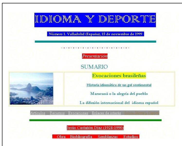
Portada del primer número en noviembre de 1999.

El lenguaje deportivo es una carrera de relevos en la que nada empieza ni termina en una persona o equipo. Ha sido motivo de satisfacción ver que algunas de las reflexiones personales de esta página web ayudaron a otras personas en el estudio de este singular ámbito lingüístico. Entre todos los sectores que participan en el idioma del deporte en español, lograrán que siga llegando más lejos, más alto y más fuerte con nuevas ideas.